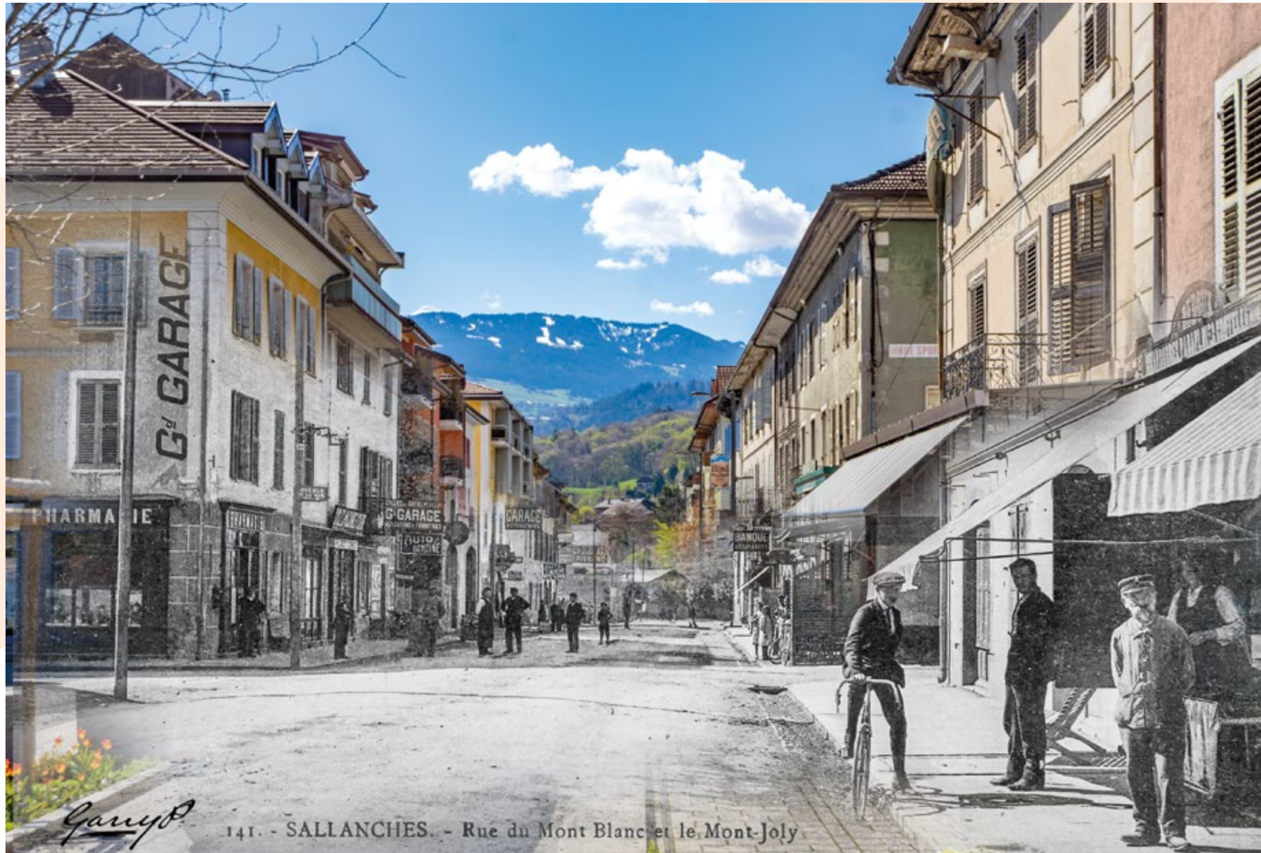
carte postale - début du XX e siècle

panneaux illustrés ponctuent l'exposition