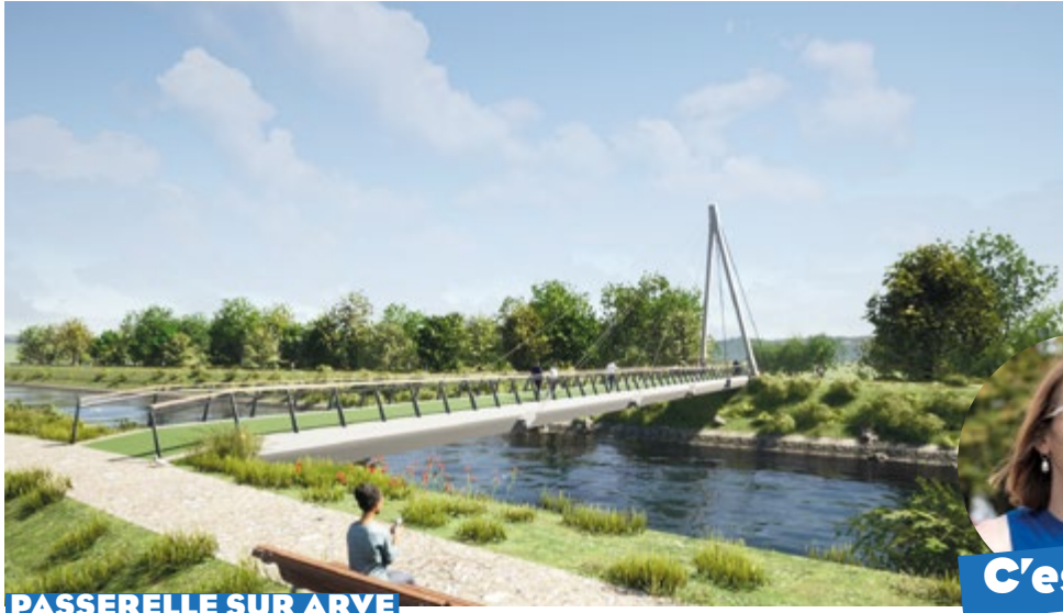
PASSERELLE SUR ARVE