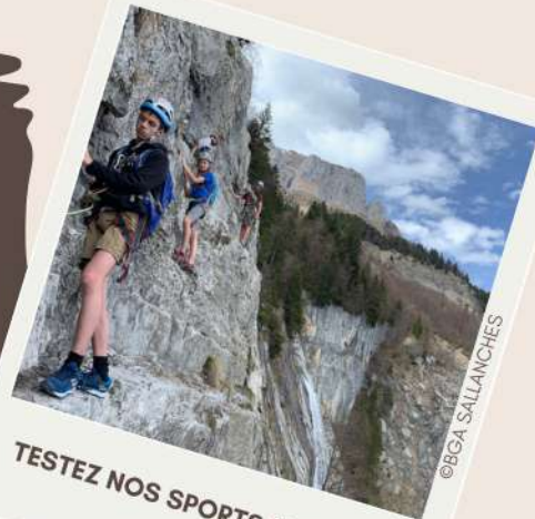
PLUTÔT SÉJOUR SPORTIF OU DÉTENTE ?