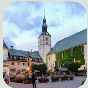
Eglise Saint Jean-Baptiste à Megève