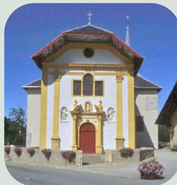
Eglise de Saint-Nicolas de Véroce