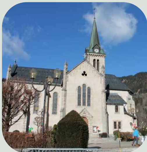
Eglise Sainte- Marie- Madeleine à Praz-sur-Arly