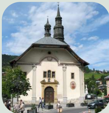
Eglise de Saint-Gervais les Bains