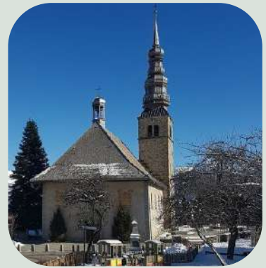
Eglise Saint-Nicolas à Combloux