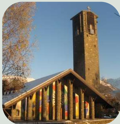
Eglise Notre-Dame de Toute Grâce au plateau d'Assy