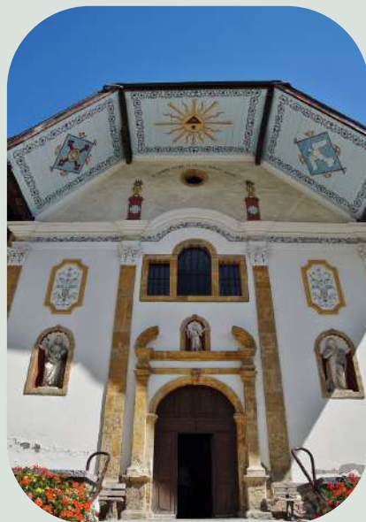
Eglise de la Sainte-Trinité