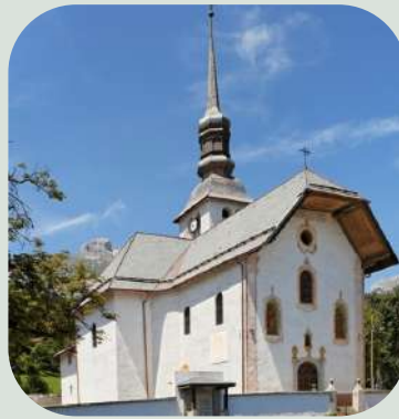
Eglise de Notre-Dame de l'Assomption à Cordon