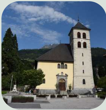
Collégiale Saint-Jacques à Sallanches

D'autres surprises vous attendent dans un tout autre style architectural à Praz-sur-Arly et au Plateau d'Assy.