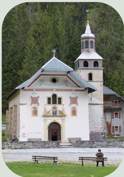
Eglise de Notre Dame de la gorge